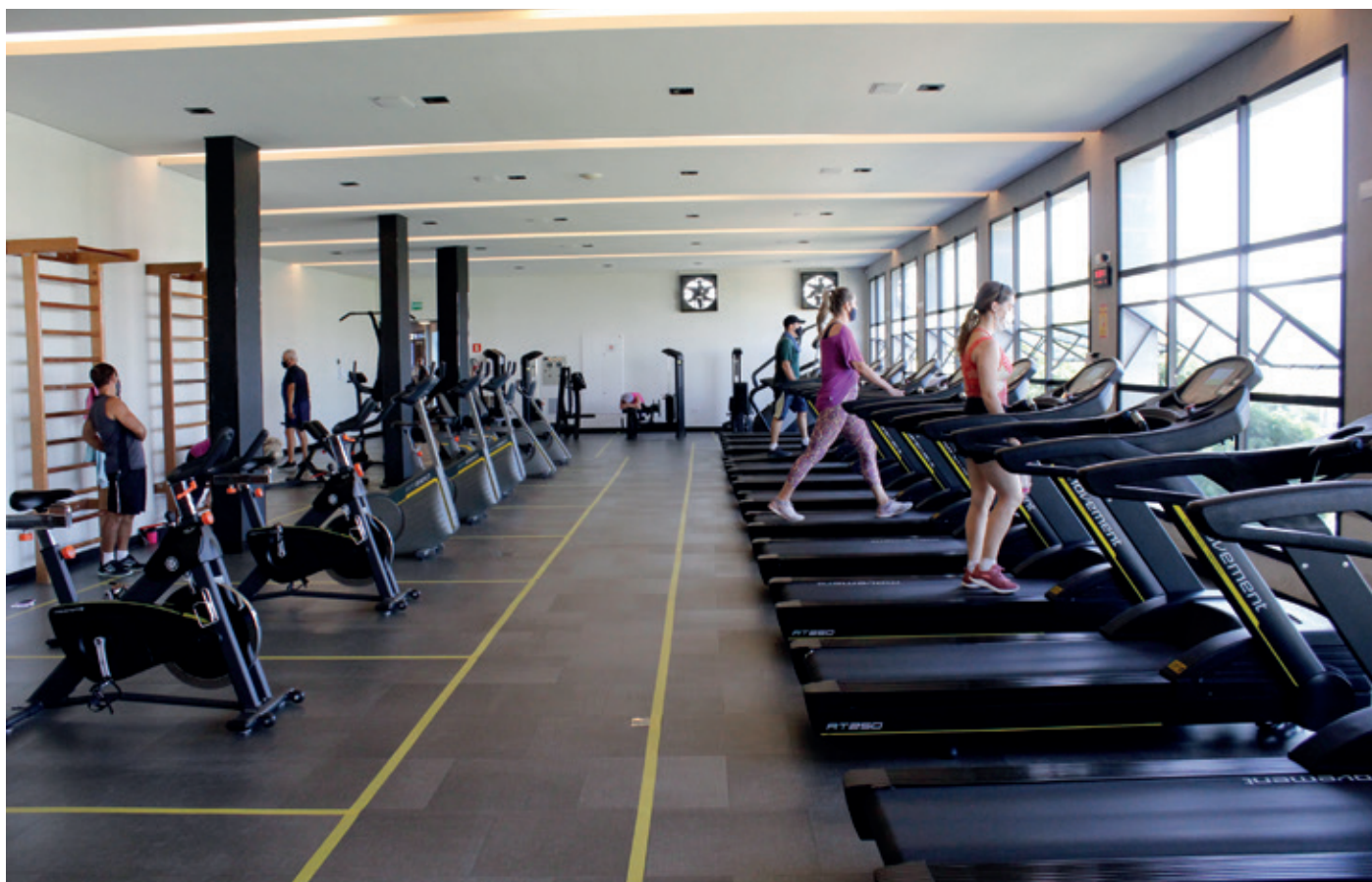
Esportes e Lazer: Investimento em novas modalidades e ampliação de horários.