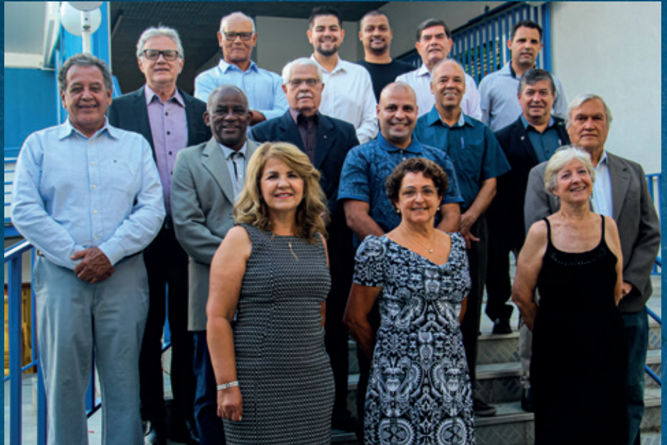
Integrantes da nova Diretoria da APVE para o triênio 2021-2023