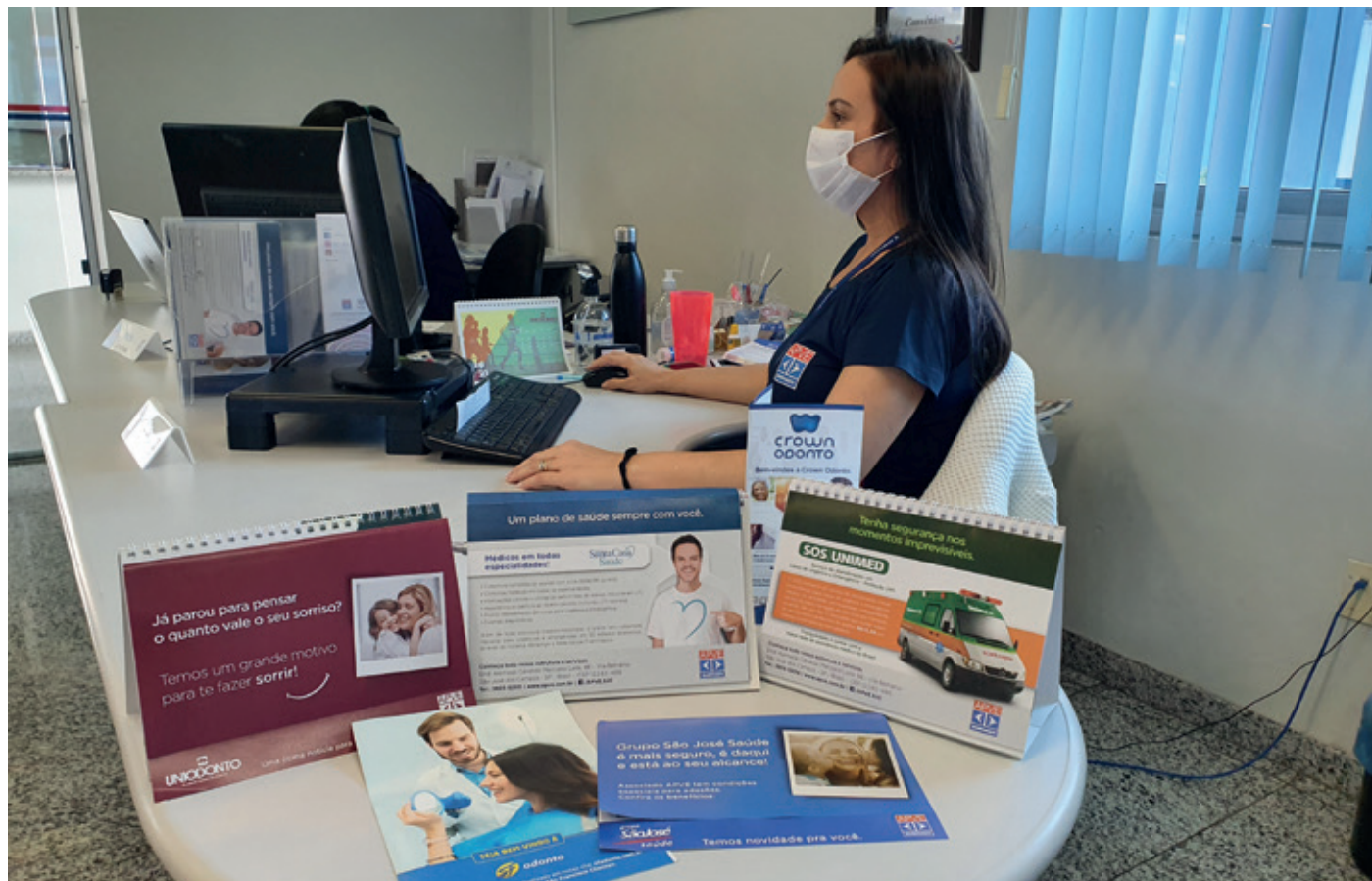
Ampliação do portfólio de convênios é uma das metas para o próximo triênio