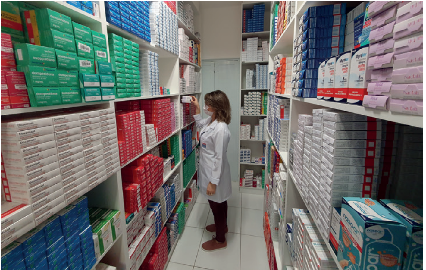
Vista parcial do estoque da Farmácia Comunitária; Ampliação da variedade de medicamentos está entre os objetivos da Diretoria.