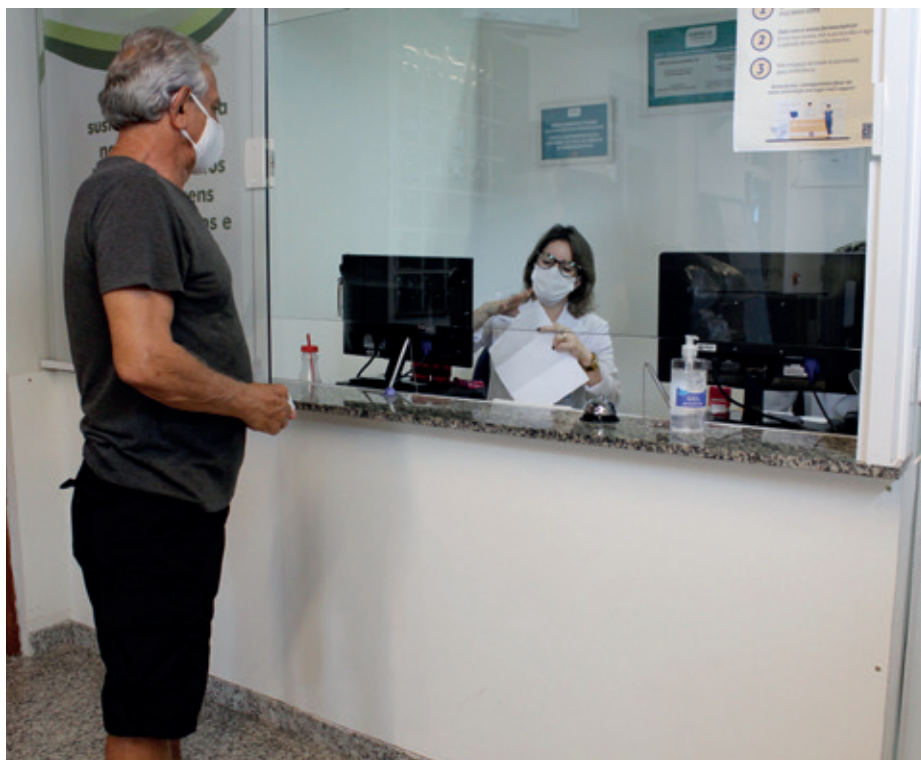
Com atendimento agendado, associado entrega receita médica para retirada de medicamentos.