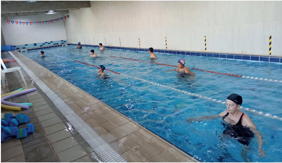
O retorno das aulas de hidroginástica promoveu o reencontro de colegas e amigos