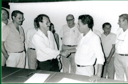
Em 1997 a Unimed e a APVE celebraram o início de uma parceria que já dura 24 anos