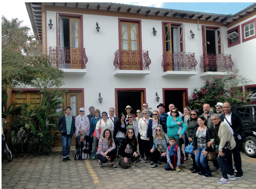
Grupo de associados da APVE durante excursão para Tiradentes (MG)