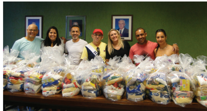
Doação de cestas