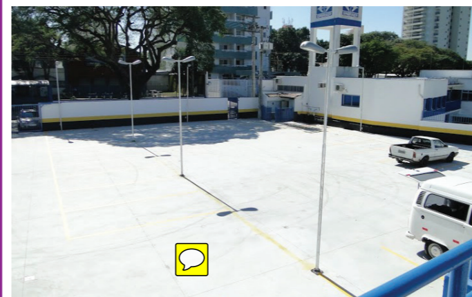
Subsolo do estacionamento

Realizada no dia 30 de julho, a inauguração do estacionamento da APVE foi marcada pela emoção e confraternização entre diretores e convidados.