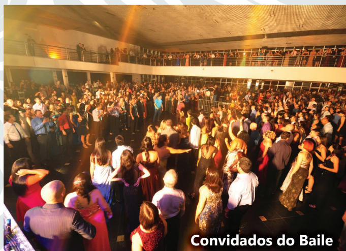
Convidados do Baile