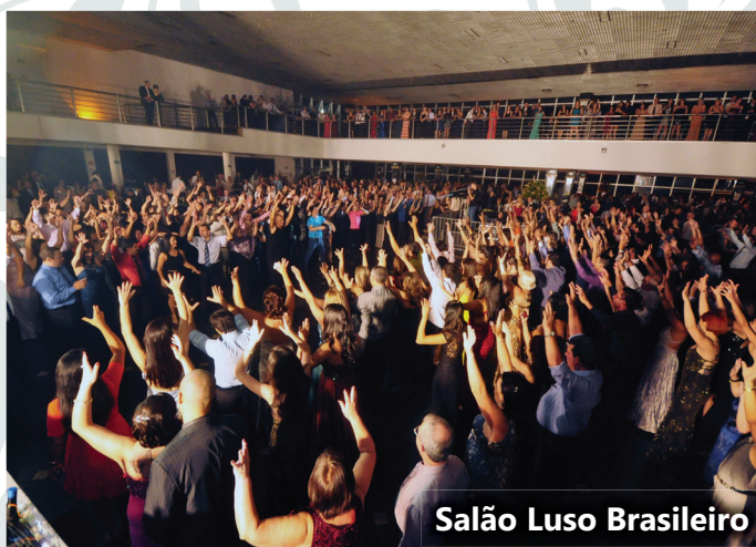
Salão Luso Brasileiro