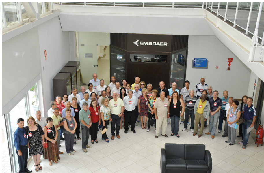
Encontro dos Fundadores e Pioneiros da Embraer de 2013

Há 17 anos a APVE tem a honra de sediar e promover o encontro de Fundadores e Pioneiros da Embraer, que se tornou uma grande oportunidade para o reencontro e a confraternização de pessoas que um dia sonharam e construíram a primeira aeronave brasileira, mudando a história da aviação no Brasil. No dia 25 de outubro, às 12h, os protagonistas dessa história se reunirão no salão nobre da APVE para brindar e celebrar a amizade, fortalecida pelo idealismo de construir um futuro melhor. Todos os fundadores e pioneiros admitidos até agosto de 1970 na Embraer são convidados, assim como os veteranos.