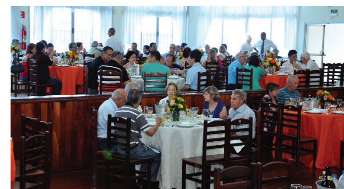
Encontro na APVE