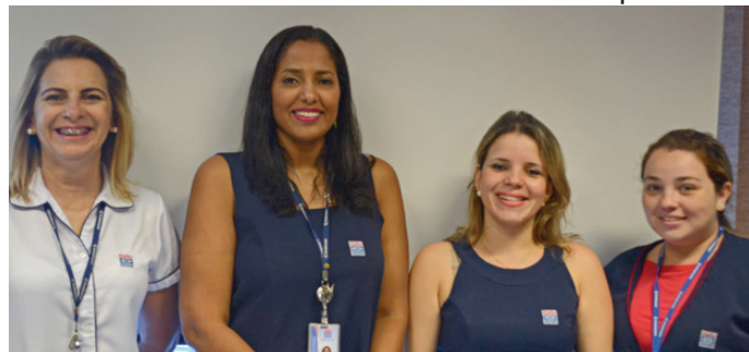
Equipe de Assistência Social da APVE

É também de responsabilidade deste setor a Farmácia Comunitária, o empréstimo de materiais ortopédicos e a doação de cestas básicas e medicamentos para os associados mediante análise socioeconômica prévia.