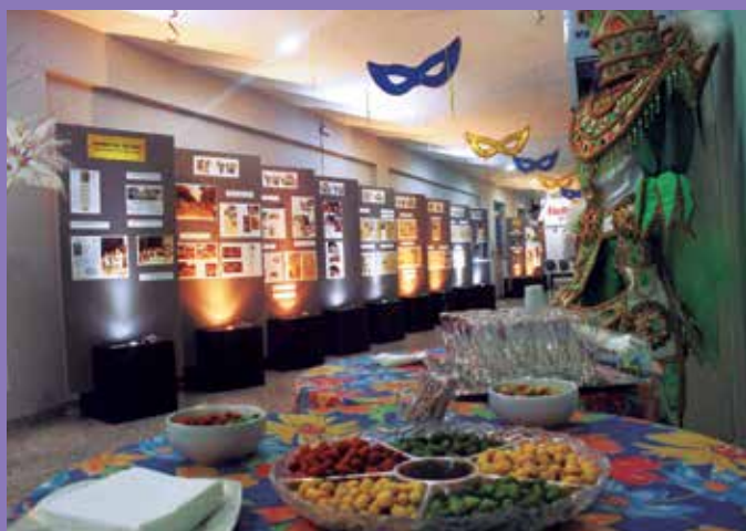
Vista parcial da exposição