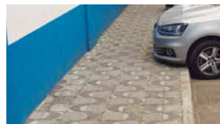
Antes: Calçada estreita com pouco espaço

Ao todo foram reformados 108m que ligam desde a entrada do Salão Nobre Ozires Silva, até a entrada do edifício Ozílio Carlos da Silva (garagem), a largura da calçada foi ampliada de 1,5 metros para 3,5 metros. A obra foi entregue em 2 meses, e já está apta para o acesso de mais de 6000 associados e frequentadores da APVE.