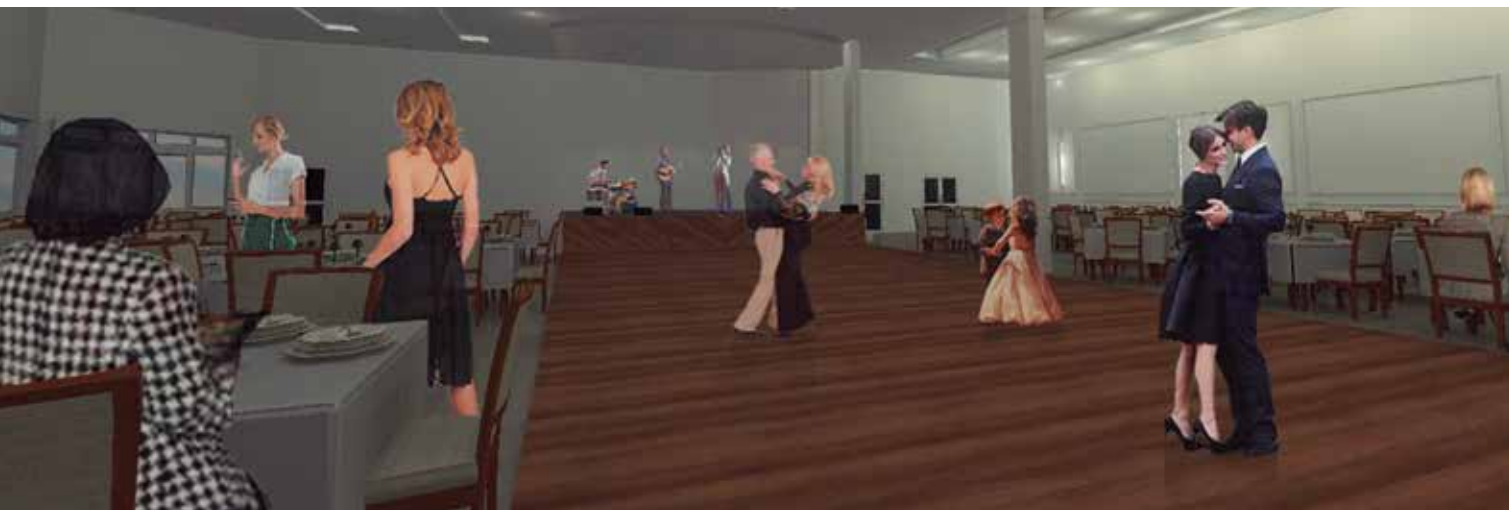
Maquete eletrônica mostra em perspectiva a pista de dança com o palco ao fundo

recebeu novos sensores de fumaça, sinalizações de emergência e a instalação de um completo sistema de monitoramento de câmeras de circuito interno. A cozinha e o bar também estão com um novo visual e com novos equipamentos.