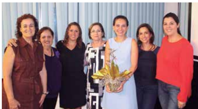
Grupo RENOPAS confraterniza com a palestrante