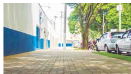
Depois: Novo calçamento e maior acessibilidade