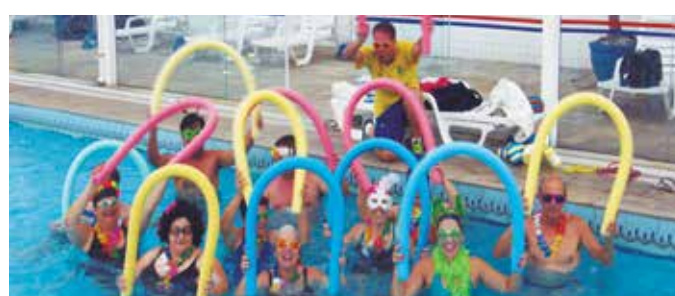
Alunos da hidroginástica dão o grito de carnaval dentro d'água