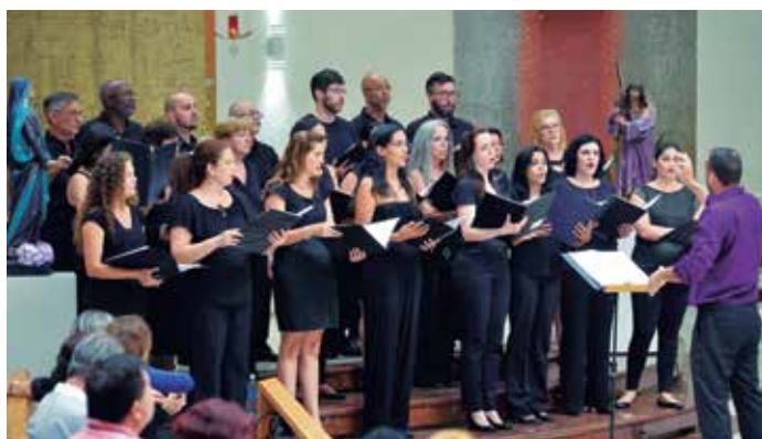
Apresentação do Coral na catedral São Dimas no dia 23 de março