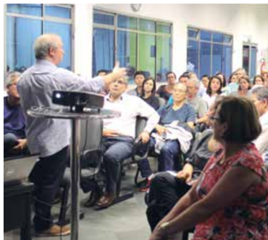
O evento foi realizado no auditório da APVE no dia 22 de fevereiro