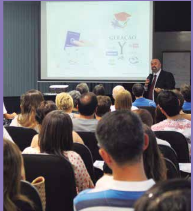
Palestra tratou de assuntos como autoanálise e debateu temas como motivação pessoal e profissional