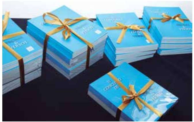
Obras classificadas fazem parte do livro produzido pela APVE