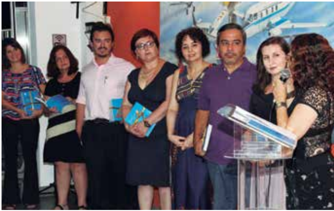
Vencedores do Concurso 2015 recebem premiação