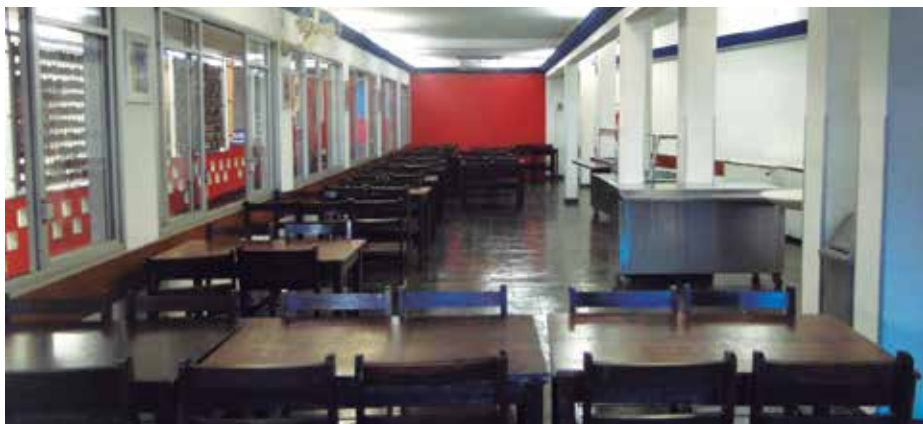
Vista parcial do salão de refeições do Restaurante Urupema

Visando melhorar a qualidade de serviço, higiene e comodidade para todos os frequentadores a APVE irá dar início à reforma no restaurante Urupema.