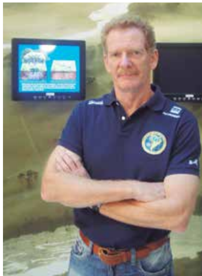
O piloto Gérard Moss utiliza aviões da Embraer durante suas expedições

Atualmente, além da palestra motivacional (Asas do Vento) em que relata o desafio de dar a volta ao mundo sozinho num pequeno motoplanador, também oferece a palestra ambiental Rios Voadores que destaca a importância da preservação da floresta amazônica em virtude dos serviços ambientais que ela fornece, e a palestra socioambiental Brasil das Águas direcionada ao tema da responsabilidade socioambiental, em que enfatiza a importância de cuidarmos dos recursos hídricos que são o pivô das nossas vidas.