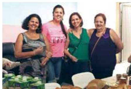
Equipe Renopas durante visita