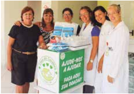
Voluntárias da Casa do Curativo

Entre as ações desenvolvidas pela DASF, está a manutenção de uma espécie de rede solidária que realiza doações para entidades filantrópicas e farmácias comunitárias da cidade.