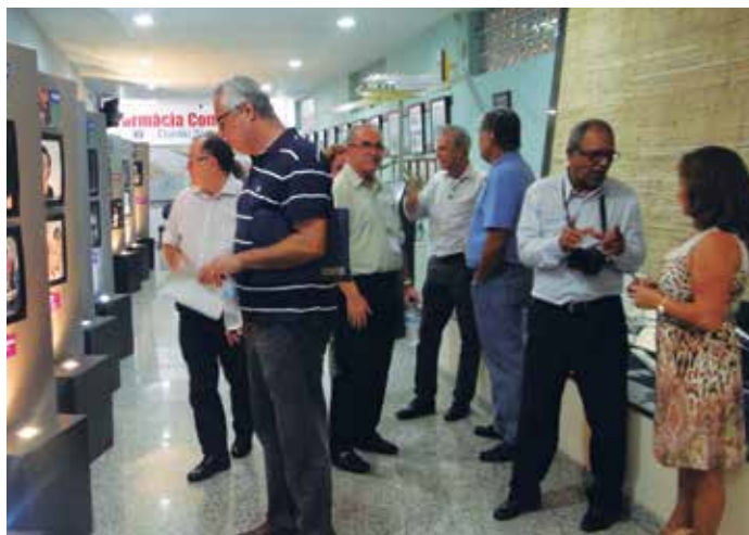
Exposição retratou mulheres frequentes às APVE