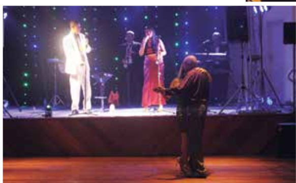
Casal na pista de dança do Salão Nobre