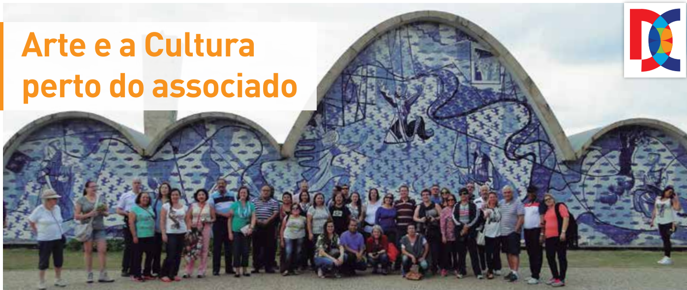
Grupo posa em frente à Igreja da Pampulha durante a “Viagem Cultural - Cidades Históricas e Inhotim”

Mantendo a tradição de aliar a cultura e o entretenimento de alto nível, a Diretoria Cultural celebra o final de 2016 contabilizando uma série de eventos de grande sucesso entre os associados e a comunidade de São José dos Campos.