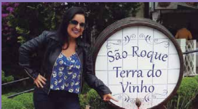
Terra do vinho encantou visitantes