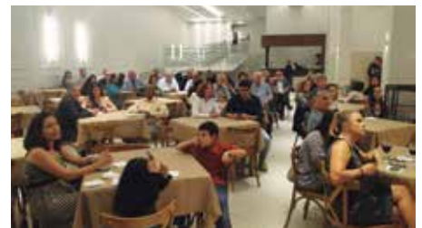
Associados prestigiam reinauguração do espaço de eventos

O Restaurante Urupema também foi contemplado com uma série de reformas estruturais e administrativas. O restaurante passou a contar com 19 mesas com capacidade para 76 pessoas. A equipe do Restaurante Jequitibá assumiu a administração do Urupema, além de comandar os cardápios e o atendimento da lanchonete e do bar durante a Sexta Dançante.