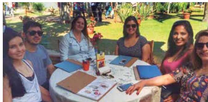
Equipe APVE conhecendo a cidade das flores