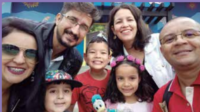
Um passeio para toda a família