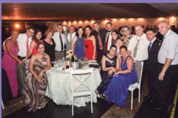
Grupo de amigos durante o Baile