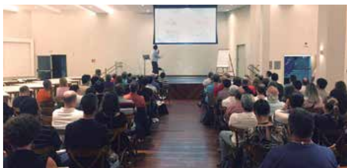
Multiplicando o conhecimento financeiro