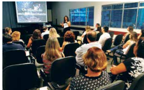
Evento contou com grande publico