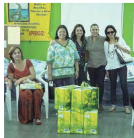
Voluntárias do RENOPAS durante ação social

aos trabalhos e conta com a sua participação. Além de ajudar ao próximo prestigiando os eventos da Diretoria realizados na APVE, você também pode fazer parte desse grupo. O RENOPAS está aberto a receber novas voluntárias sócias da APVE, esposas dos associados e demais mulheres da comunidade. Ficou interessada? Entre em contato com o RENOPAS através do e-mail renopas@apve.com.br .