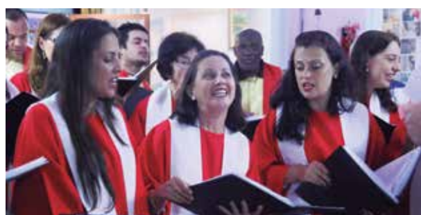
Apresentação em entidade beneficente