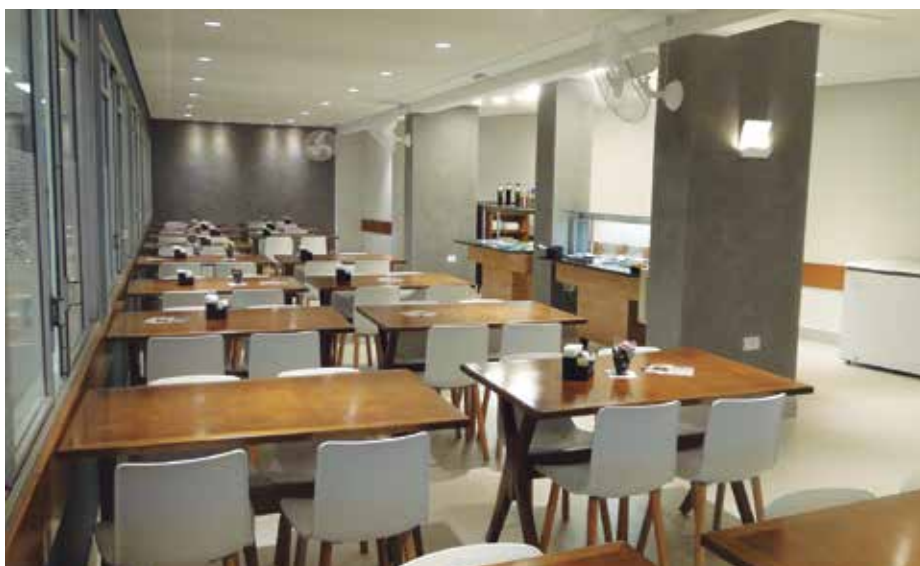
O Restaurante Urupema passou a contar com 19 mesas e capacidade para atender 76 pessoas

Entre as comodidades estão a possibilidade de emissão da segunda via de boletos, visualização de consultas e procedimentos médicos, além da impressão do Informe de Rendimentos do Imposto de Renda entre outros benefícios práticos e cômodos.