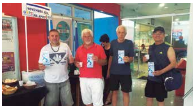
Saúde e prevenção para os homens