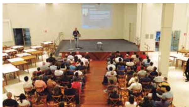
Publico prestigia evento no Salão Nobre