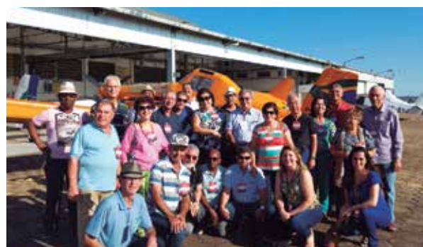
Veteranos reencontram Unidade