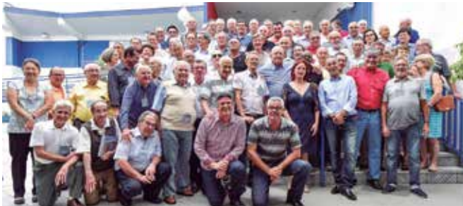
Convidados reunidos para a tradicional foto anual