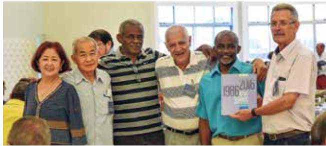
Livro dos 30 anos lançado no Encontro de Pioneiros