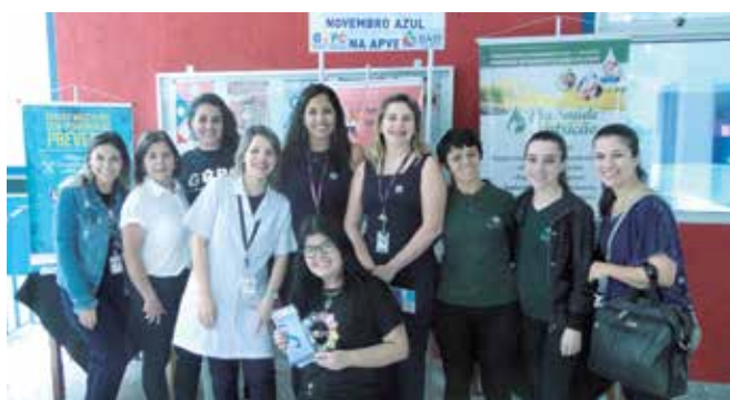
Equipe DASF realiza evento em parceria com o GAPC