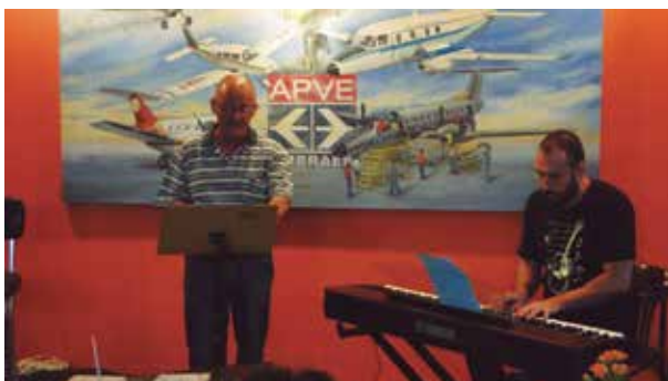
Musica de bom gosto no Cyber Café