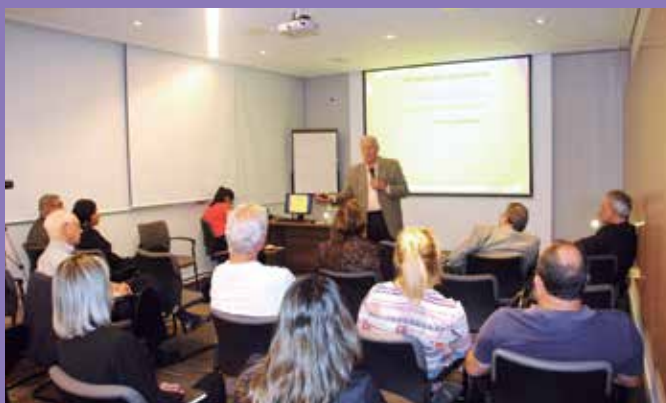
Aula inaugural apresenta a metodologia dos cursos da Universidade