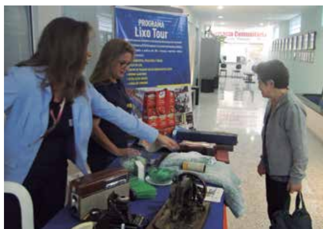
A Diretoria Cultural instalou um estande para divulgar a importância da coleta seletiva