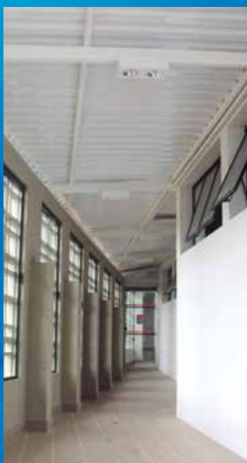
Corredor coberto de ligação entre as piscinas da APVE