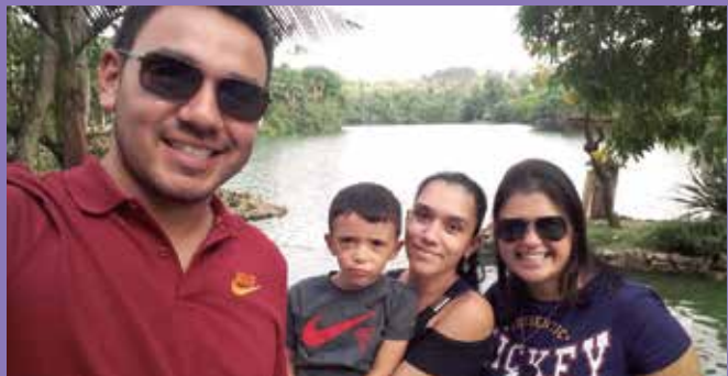
A visita ao zoológico foi um excelente programa para toda a família