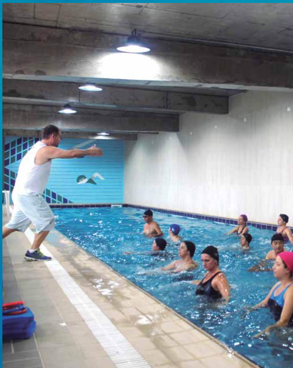
Alunos durante aula na nova piscina de hidroginástica da APVE