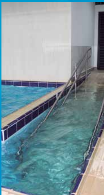
Rampa de acesso para a piscina