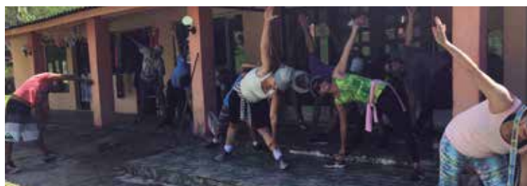
Alunos do curso de Yoga da APVE durante viagem de formatura em Pindamonhangaba