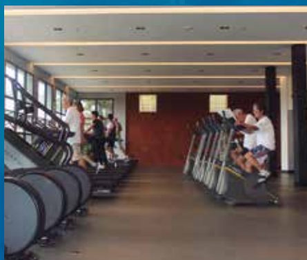
Alunos no novo espaço da academia