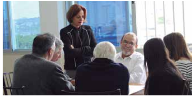
World Café abriu a organização para o Encontro de Escritores e Jornalistas deste ano