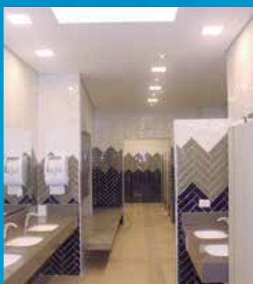
Vista parcial do vestiário