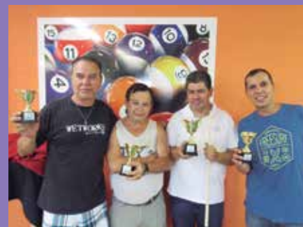
Entrega de troféus aos vencedores do Torneio de Bilhar da APVE