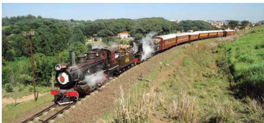
Maria Fumaça a caminho da estação Luis Carlos, em Guararema

A cidade de Guararema será o destino da próxima excursão promovida pela Diretoria Cultural. Com a Mata Atlântica em boa parte do território do município e o Rio Paraíba do Sul cortando a cidade, a programação do passeio inclui visitas aos mais belos pontos turísticos da cidade como a colônia de plantação de orquídeas, o centro histórico e o imperdível passeio de Maria Fumaça, no trecho entre a estação Central e a estação da Vila Luis Carlos, perfazendo o total de 6,8 km. A Estação de Guararema, construída em 1891, totalmente restaurada, conta com infraestrutura e acessibilidade necessárias para a operação.