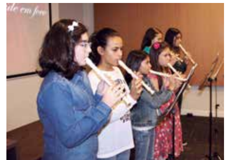
Homenagem ao Dia das Mães