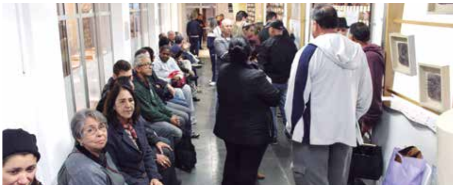
Associados aguardam o início da venda dos convites para o Baile