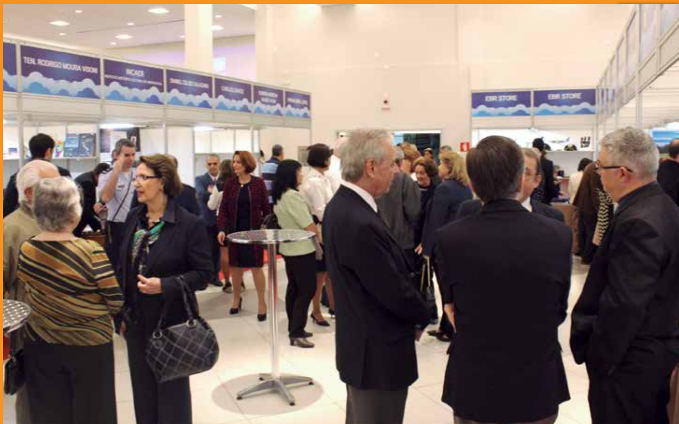
Participantes do encontro reunidos na área de estandes de venda e exposição de livros instalados no Salão Nobre da APVE