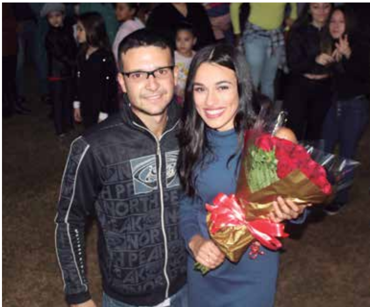
Festa Junina teve até pedido oficial de casamento