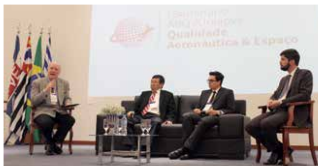
Empresários participam do 1º Seminário ABQ/Uniapve de Qualidade Aeronáutica e Espaço