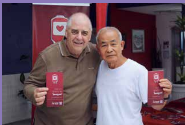
Campanha de conscientização da importância da doação de sangue