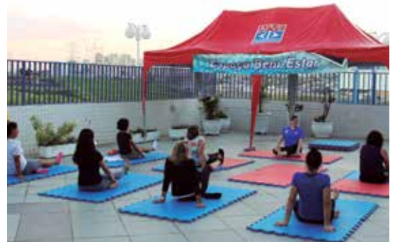
Associados se reuniram para atividades físicas