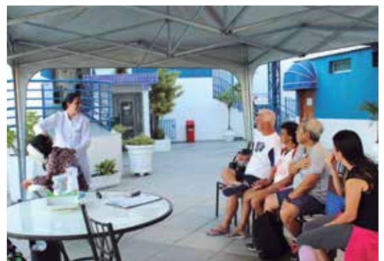
Para comemorar o Dia das Mães, associados se reuniram para sessão de massagem