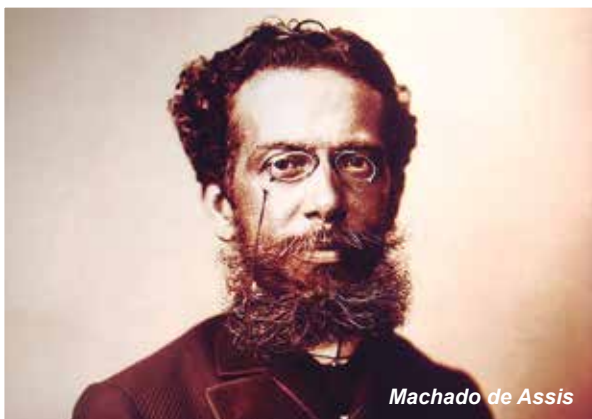
Machado de Assis