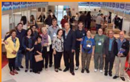
Evento contou com a presença de personalidades e convidados durante três dias

31 ESCRITORES e JORNALISTAS 1.500 PESSOAS durante três dias