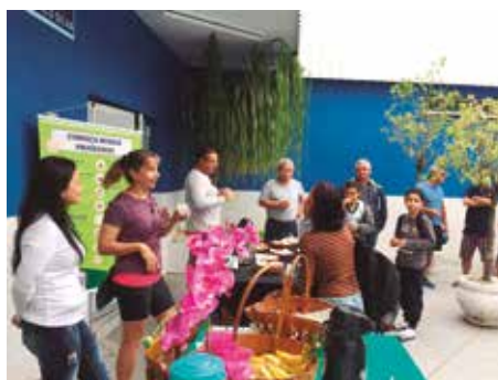
Ação promovida pela Unimed teve o objetivo de conscientizar a população sobre a importância de ter uma vida saudável, com os cuidados necessários