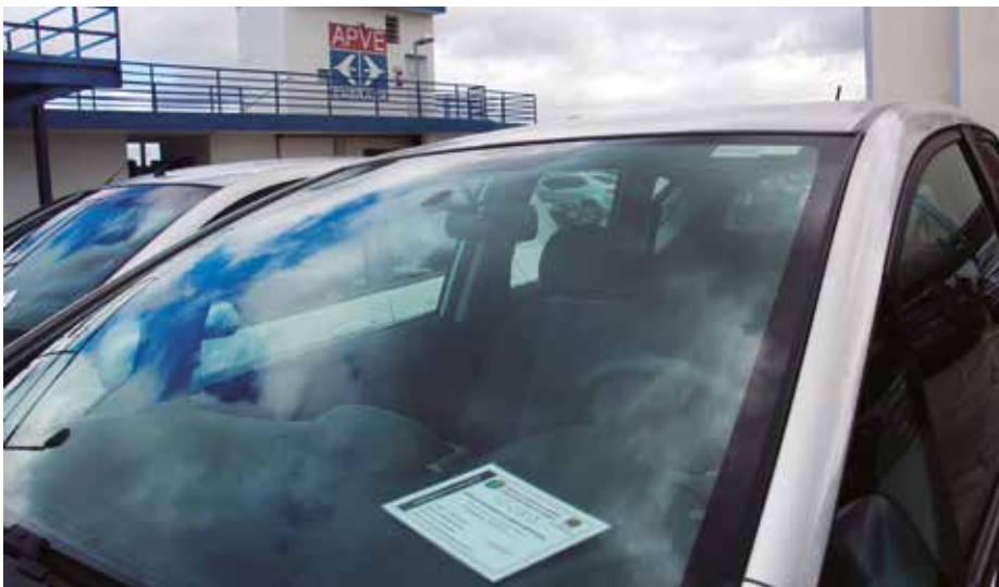
Automóvel identificado com cartão do idoso