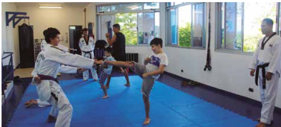
Modalidade se tornou atividade fixa da APVE e está disponível para diversas idades