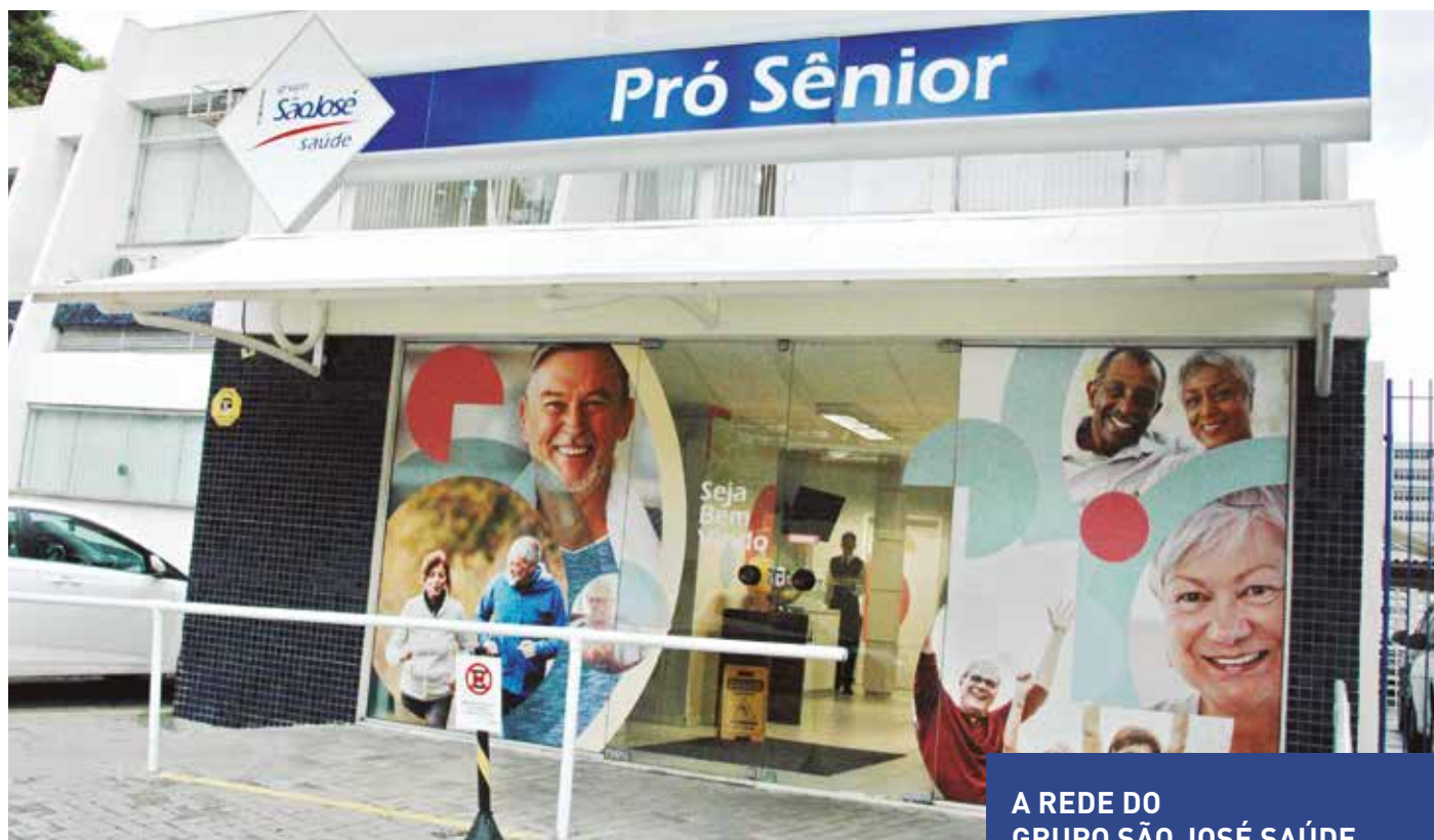
Fachada de uma das clínicas do Grupo São José Saúde