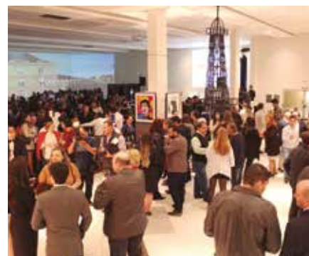
O evento contou com a presença maciça de grandes personalidades da região