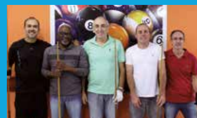
Vencedores da primeira etapa largam na frente no Torneio de Bilhar 2019

O calendário da temporada de torneios já está definido para os próximos meses. Em junho e outubro serão disputadas os torneios na modalidade individual. Em agosto e em dezembro, as duplas voltam a competir.