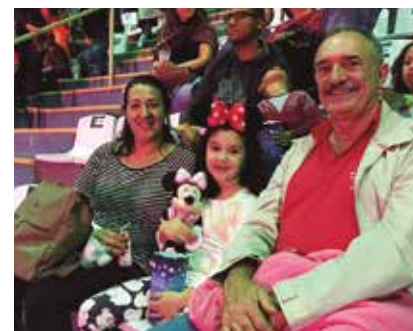
O espetáculo da "Fábrica de Sonhos" encantou à todas as idades