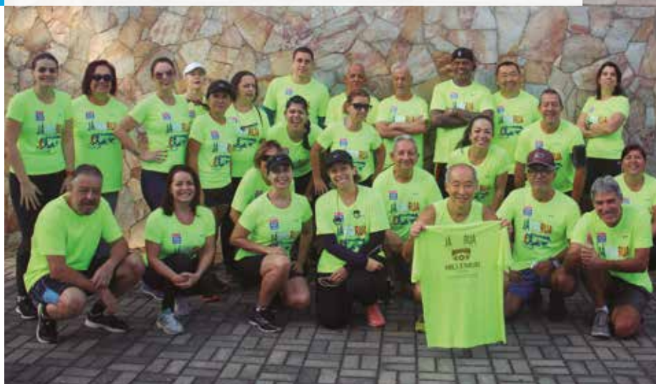
Parte dos integrantes do "Já Prá Rua" posam pra foto com a nova camiseta da equipe

A equipe de corrida e caminhada "Já Prá Rua" da APVE recebeu mais um apoio importante para garantir o incentivo aos treinos semanais e o estímulo nas competições.