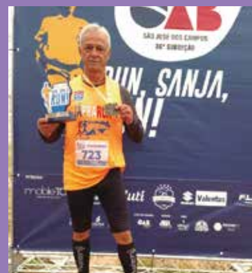
Atletas da APVE foram destaque em prova realizada no dia 9 de junho