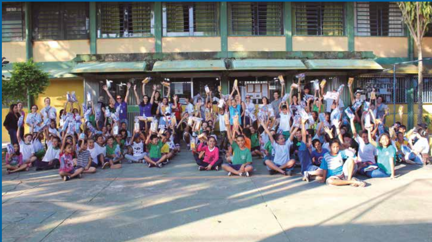
As equipes da APVE e do Renopas realizaram entregas na AFFA, nas comunidades rurais de Piedade e Capão Grosso e na escola José Frederico Marques