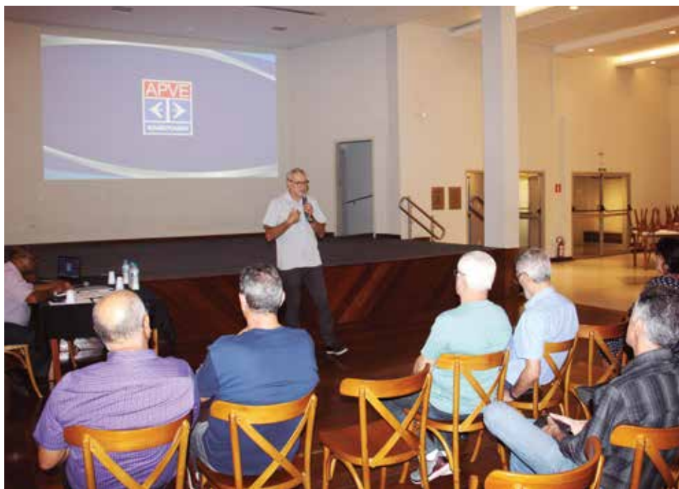
Associados durante apresentação dos itens atualizados do Estatuto da APVE