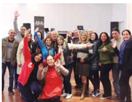
Público presente se deliciou e contribuiu com projetos sociais da região