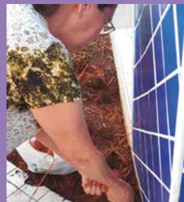
Nossa turma engajada em cuidar e preservar o verde de nossa Associação