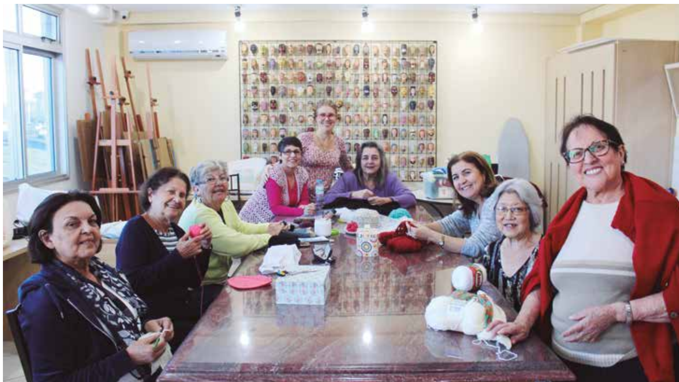
Chá com Arte: grupo de alunas se encontram semanalmente para aulas de tricô e crochê