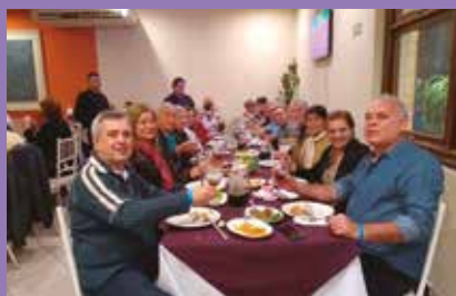
Nossos viajantes desfrutaram das belezas, da gastronomia e das diversas opções de passeios da capital paranaense