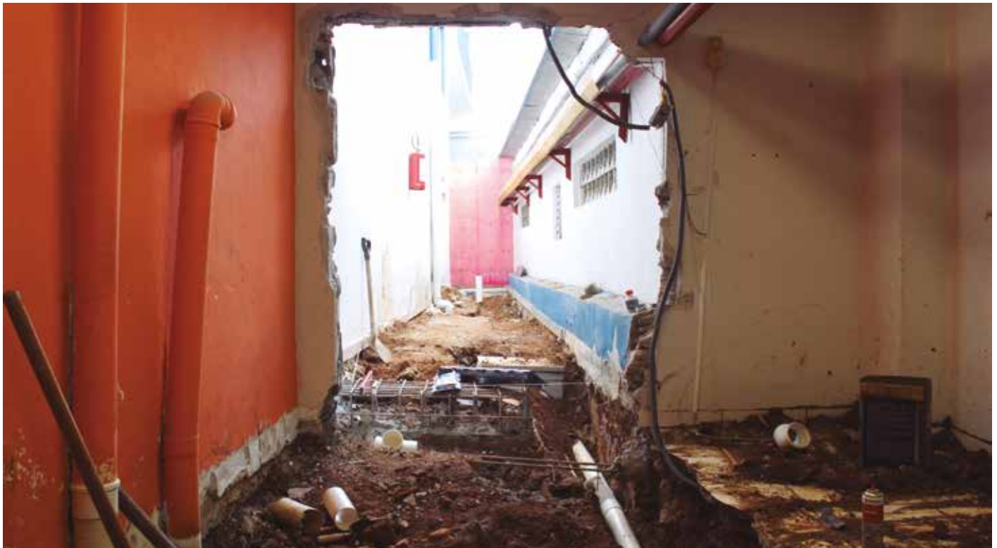
Obras de acesso à APVE no segundo subsolo do estacionamento