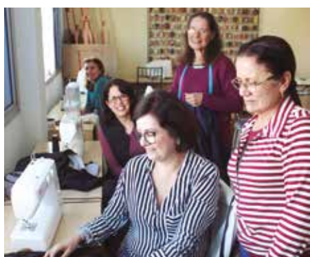
Alunas da aula de corte e costura

Para saber sobre os cursos oferecidos pela Diretoria Cultural e a abertura de novas vagas, entre em contato pelo telefone (12) 3925-5209.