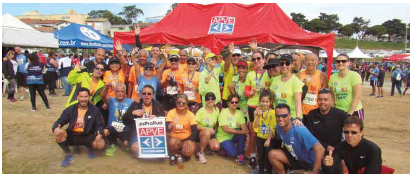
Atletas da equipe JáPraRua da APVE marcaram presença na corrida de aniversário da cidade