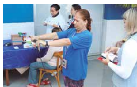
Droga Raia e APVE promoveram exames gratuitos para os associados