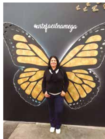
Feira de SP é o local ideal para os amantes da arte